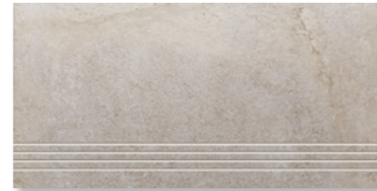
BET 615 Z 110 zement · cement