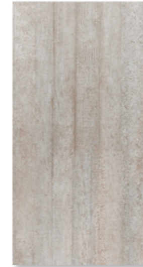
BET 935 U 122 Relief zement · cement 30 x 60 cm