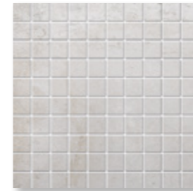
BET 401 D 129 hellgrau · light grey 2,7 x 2,7 cm (R10/B)