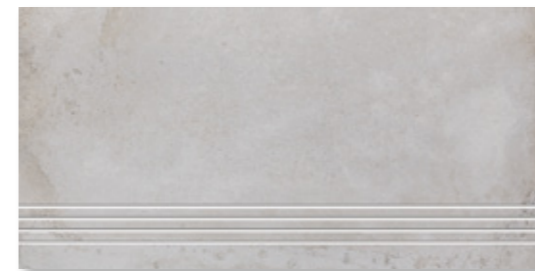
BET 611 Z 110 hellgrau · light grey