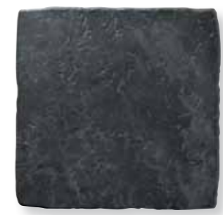
Antiqva Nero 32,5x32,5