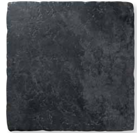
Antiqva Nero 49x49