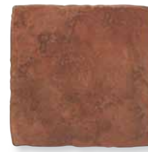
Antiqva Rosso 32,5x32,5