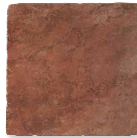
Antiqva Rosso 49x49