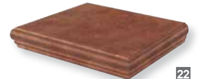
• Angolare Toro 32,5x32,5