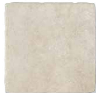
Antiqva Bianco 32,5x32,5 *