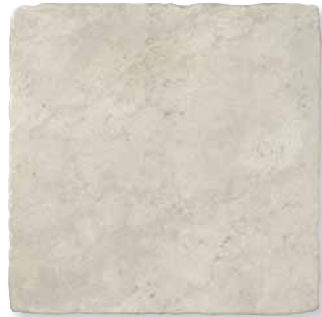
Antiqva Bianco 49x49 *