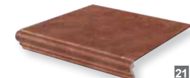
• Gradone Toro 32,5x32,5