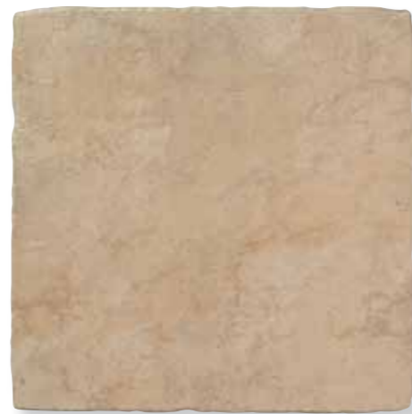
Antiqva Noce 49x49 *