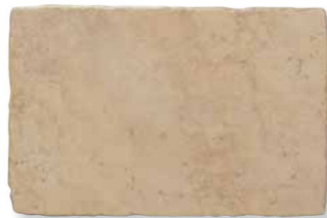
Antiqva Noce 32,5x49 *