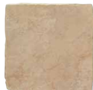
Antiqva Noce 32,5x32,5 *