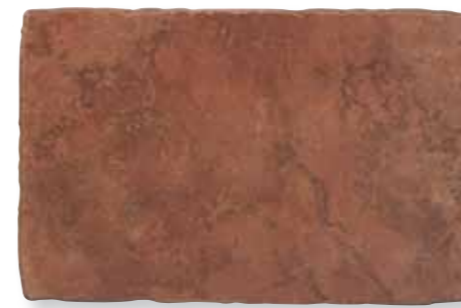
Antiqva Rosso 32,5x49