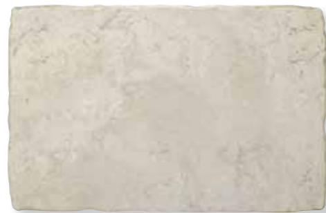
Antiqva Bianco 32,5x49 *