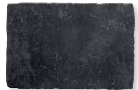
Antiqva Nero 32,5x49